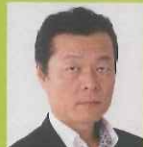
特定社会保険労務士